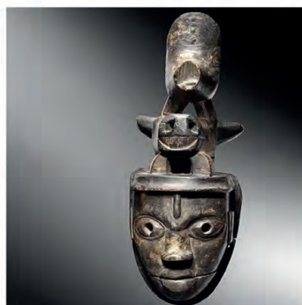
Masque Ogoni, Elu