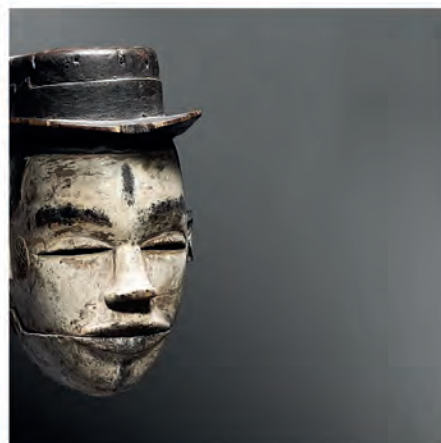
Masque Ogoni, Elu