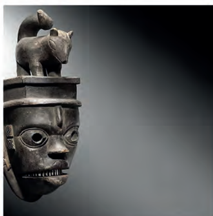
Masque Ogoni, Elu