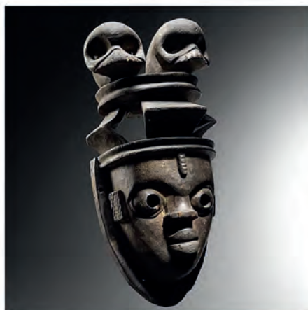
Masque Ogoni, Elu