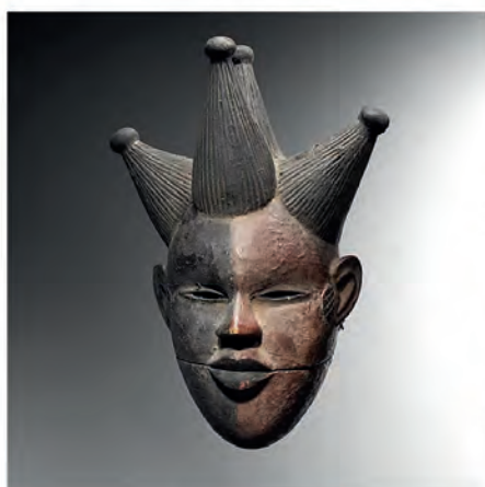
Masque Ogoni, Elu