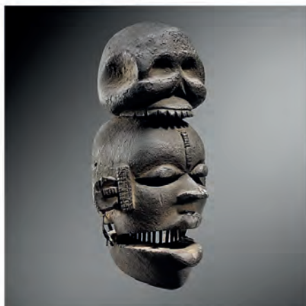
Masque Ogoni, Elu